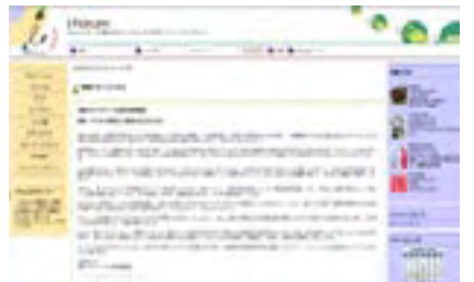
IBM i マニフェストのホームページ www.iforum.ne.jp

山本 武藤さんの言う「圧倒的な優位 性」はその通りですね。私は、システ ム /3 を基点とする IBM の一連のミッ ドレンジマシンの販売に長く携わり、 AS/400 に育てられました。AS/400 の 前身であるシステム /38 が登場した時 は、これこそ当時山積していた課題を 解決する夢のマシンだと感動したもので